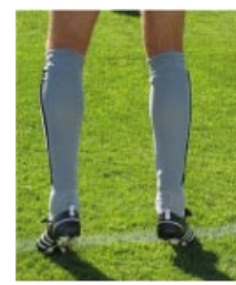
Spannung im Fussbereich